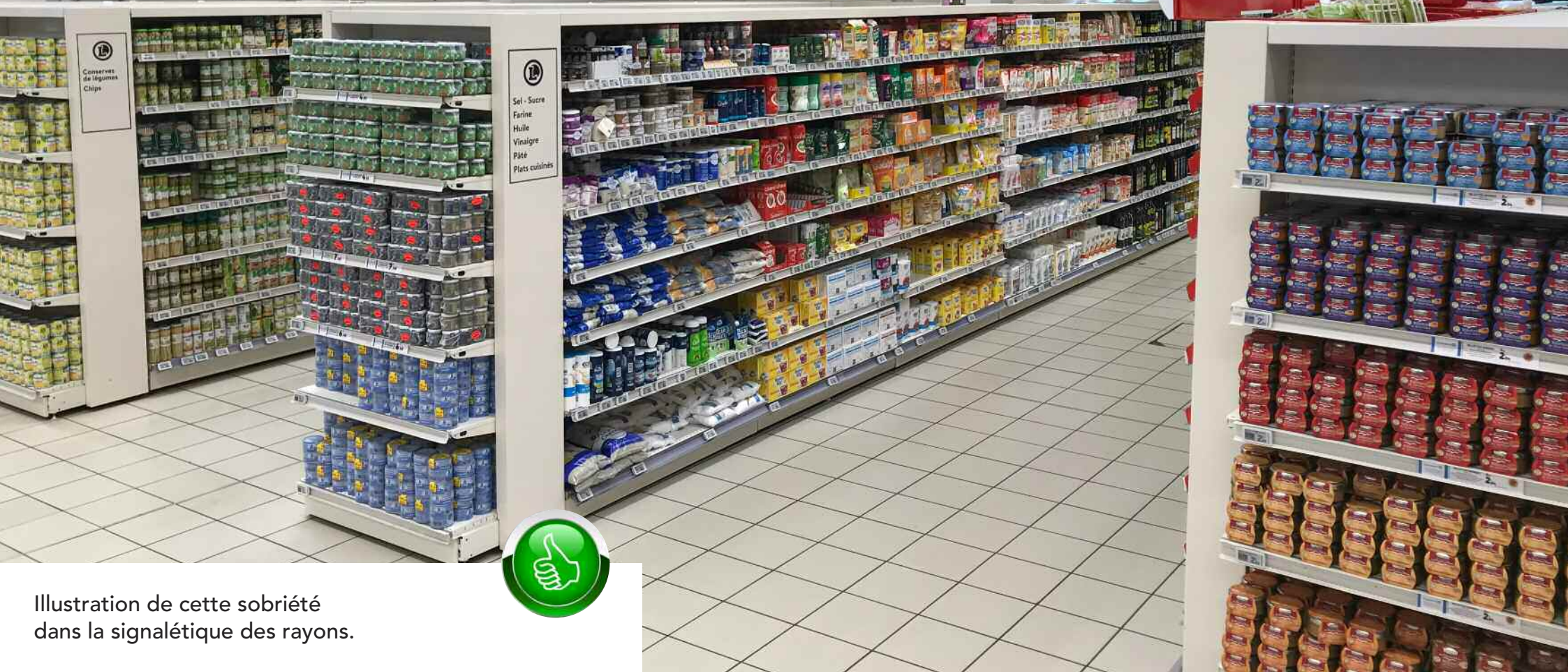
Illustration de cette sobriété dans la signalétique des rayons.